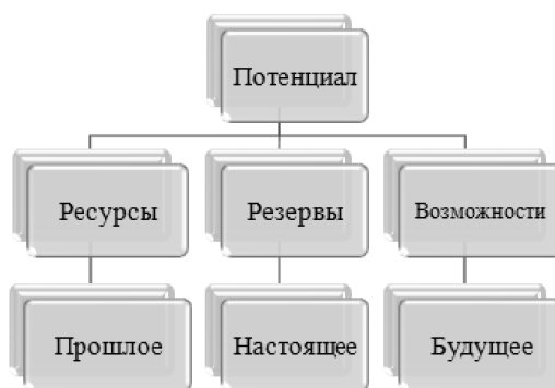
Рис. 3. Потенциальные уровни связей и отношений