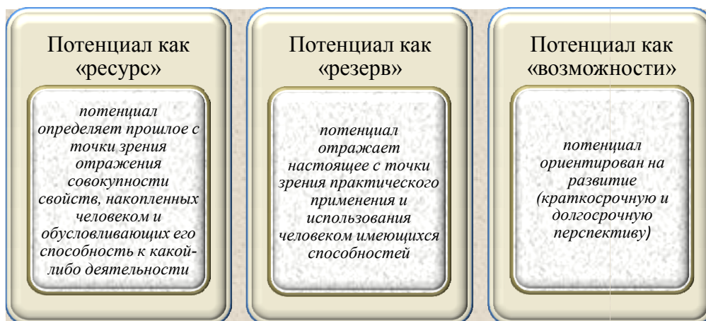
Рис. 2. Уровни проявления потенциала